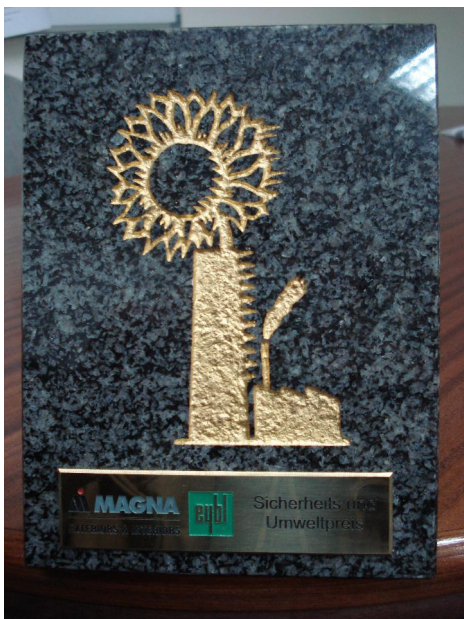
Abbildung des Sicherheits- und Umweltpreises